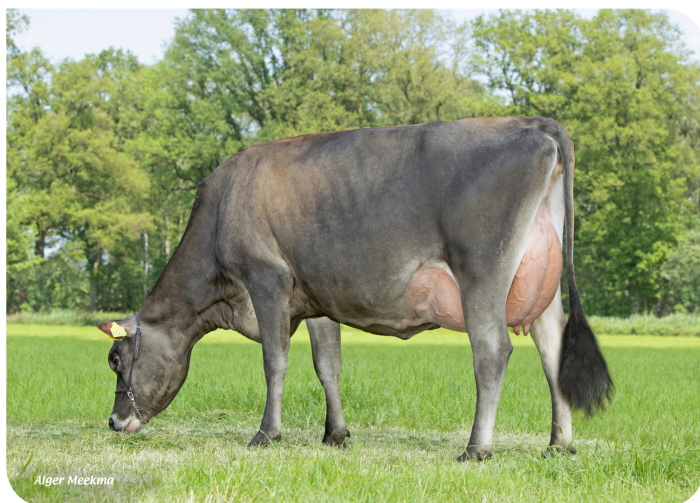
Jessy 9561 (V. Trenton Pp) Bes.: Mts. ter Mors, Haakbergen (NL)