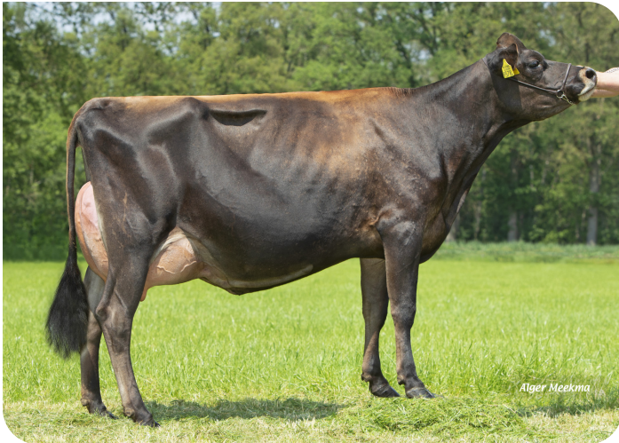
Annejet 9578 (V. Trenton Pp) Bes.: Mts. ter Mors, Haakbergen (NL)