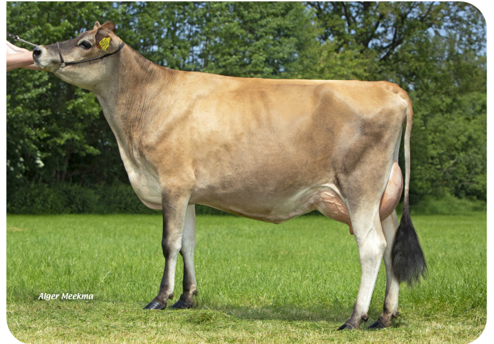
Missy 9581 (V. Trenton Pp) Bes.: Mts. ter Mors, Haakbergen (NL)