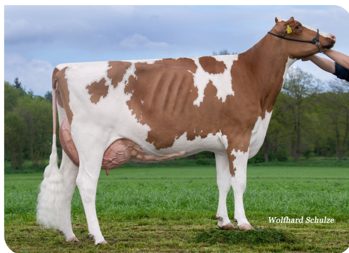
BEE Pep Mathilda N.C. (V. Pep-Red) Bes.: LOH-AN Holsteins (DE) / Bienstädt Agrar (DE)