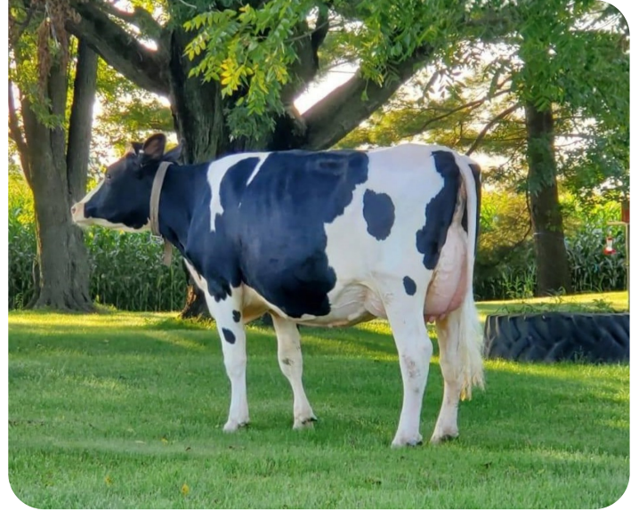
Wenger Pep 573 (V. Pep-Red)