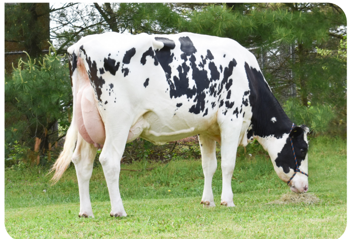
Garden-State Pep Debbie (V. Pep-Red) (VG-86 2yr) Bes.: Kevin Beiler, New Jersey, USA