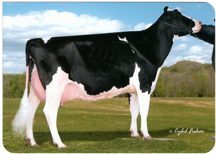
Windy-Knoll-View Profile (EX 90) (Mutter von Pep-Red)