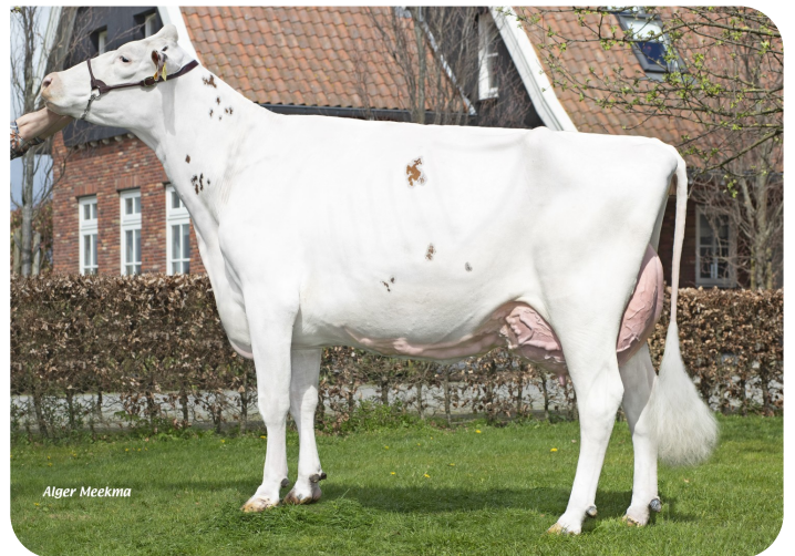
Wilskracht Warsi 879 Mutter von Camino Red