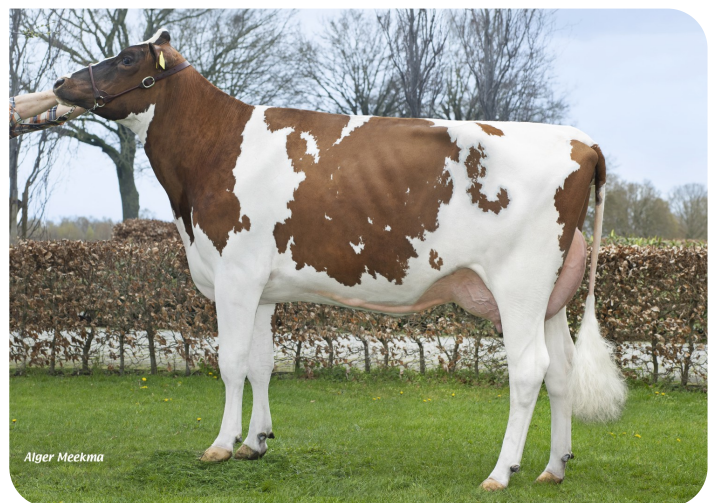
Wilskracht Warsi 1319 P (VG 87) Mutter von Aspire Red PP