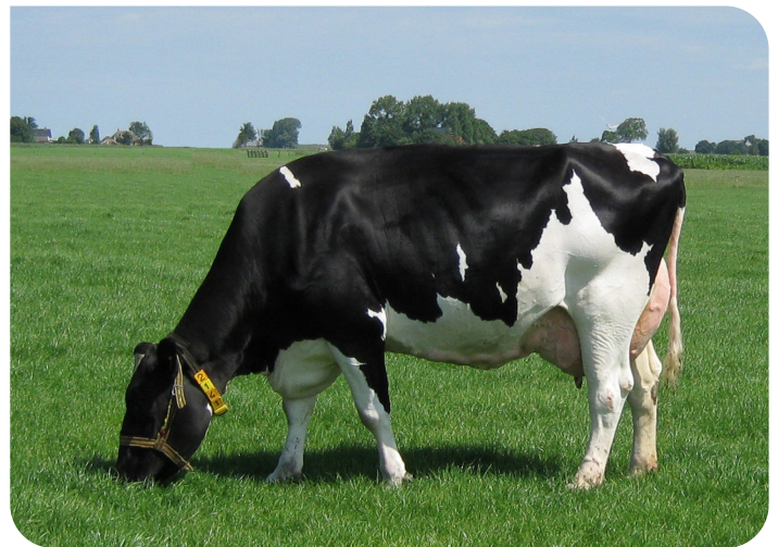
Skalsumer Pietje 736 Ur-Urgroßmutter von Paw Patrol