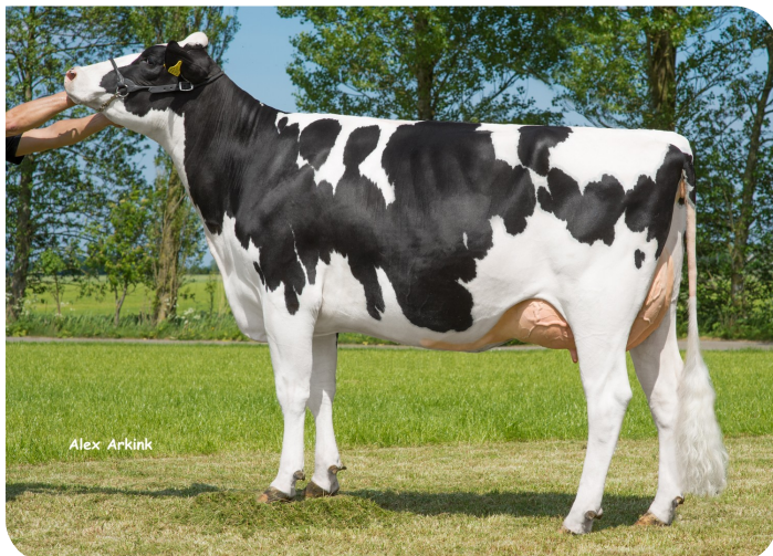
Skalsumer Pietje 981 Großmutter von Paw Patrol