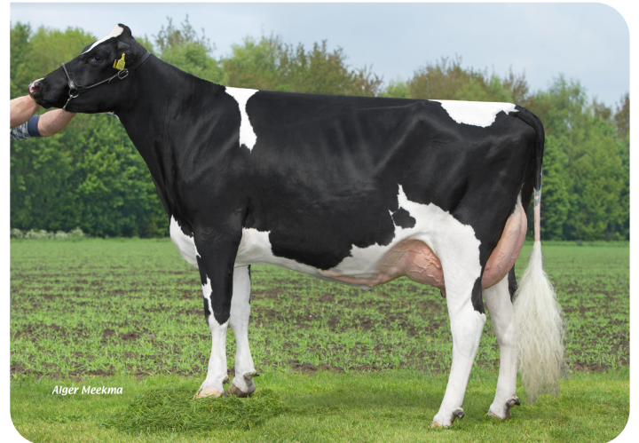
Grashoek Frida 81 (V. Ashburton) Bes.: Melkveebedrijf Grashoek b.v., Grashoek (NL)