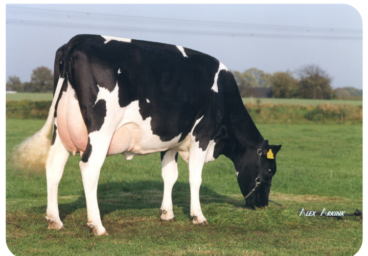
Weggelhorster Dirndel 24 (EX 90) (Großmutter von Ashburton)