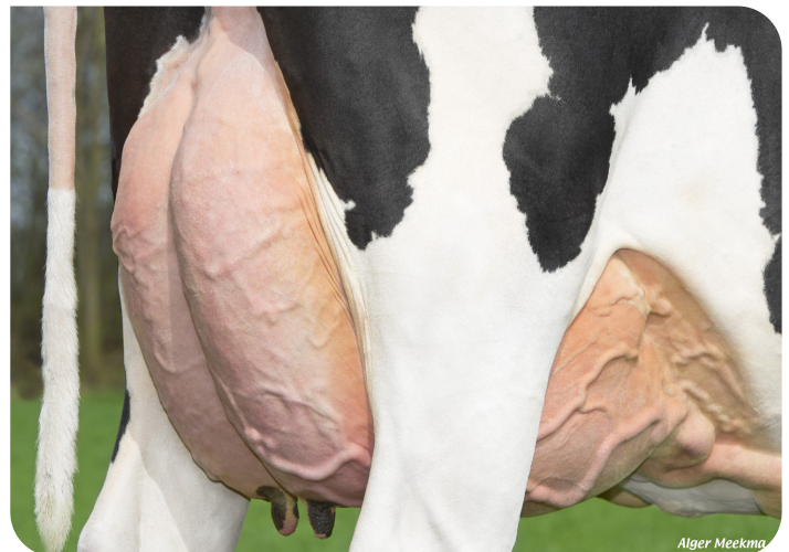
Euter von Maaike 360 (V. Ashburton) Bes.: Vreba Melkvee B.V., Vredepeel (NL)