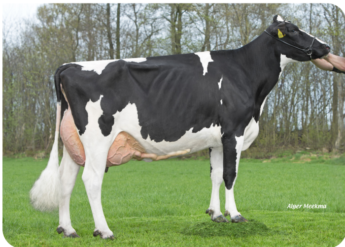
Maaike 360 (V. Ashburton) Bes.: Vreba Melkvee B.V., Vredepeel (NL)

2.00 317 Tg. 10702 kg 4.42% 3.51% 3.00 333 Tg. 11154 kg 4.88% 3.83% 4.00 299 Tg. 10785 kg 4.96% 3.79% 5.00 338 Tg. 15122 kg 4.66% 3.55% 6.01 373 Tg. 17976 kg 4.74% 3.62% 7.05 358 Tg. 17387 kg 4.55% 3.45% 8.07 427 Tg. 14288 kg 5.43% 3.71% 91 90 89 EX 90