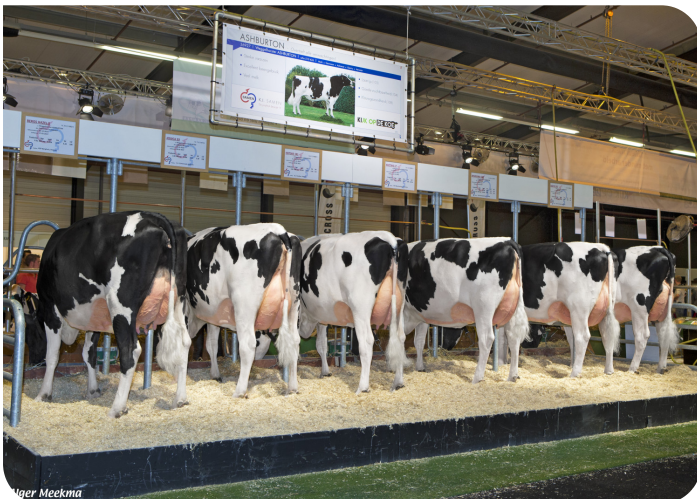
Nachzuchtgruppe von Ashburton Hardenberg 2017