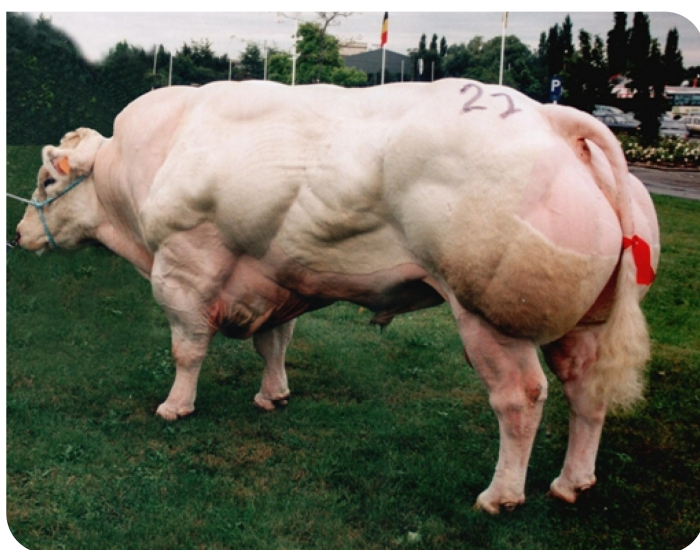
Neuf 4950 Ry Neuf Moulin (Vater von Wacko)