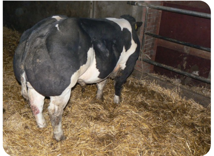
Sohn von Wacko mit Excellente Hinterviertel (10 Monaten)