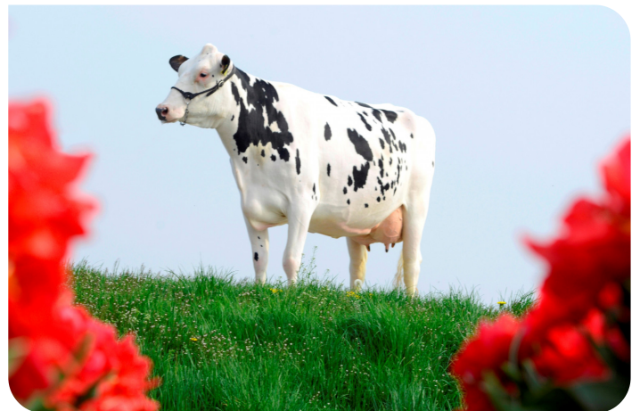
VVH Isa 12 (EX 90)