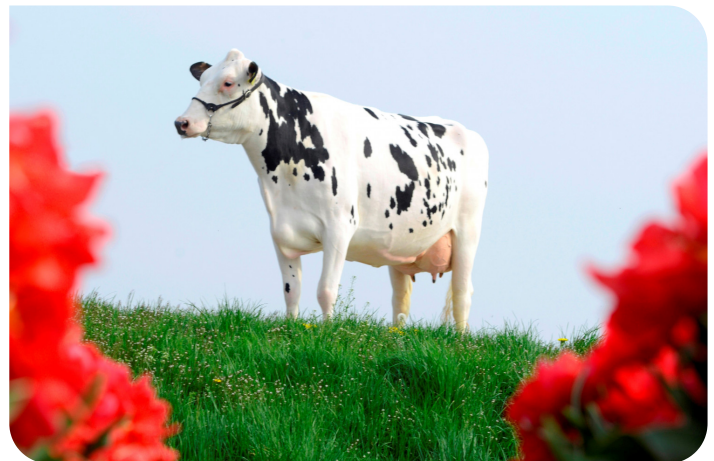
VVH Isa 12 (EX 90)