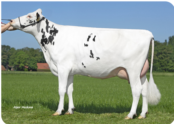
Nella 1419 (V. Snapshot)