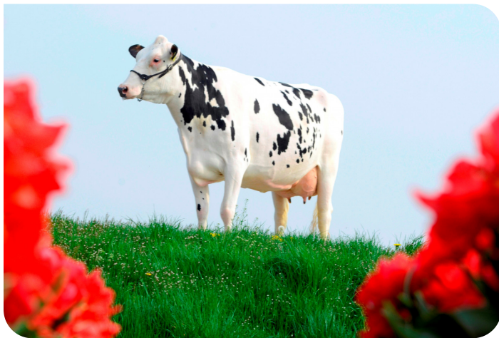
VVH Isa 12 (EX 90) (Großmutter von VVH Perico rf)