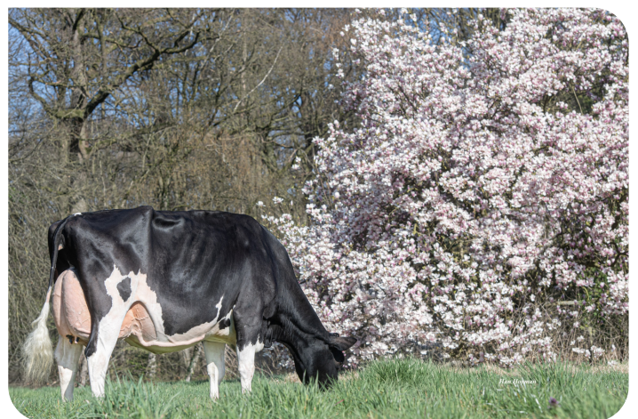
VDR Sandra 5 Mutter von Stravinsky