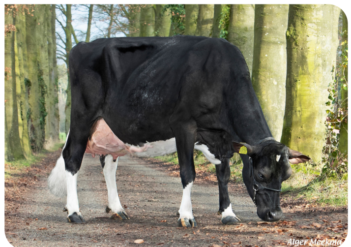
VDR Sandra 5 Mutter von Stravinsky