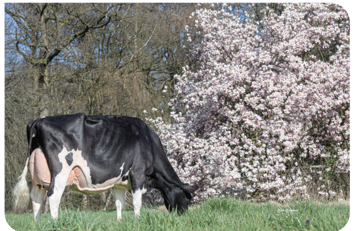
VDR Sandra 5 Mutter von Stravinsky