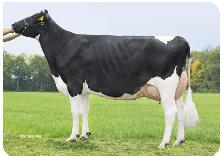
Grashoek Vrije Tulp 81 (VG 87) (v. Slash) Bes.: Fok- en melkveebedrijf K.I. SAMEN, Grashoek