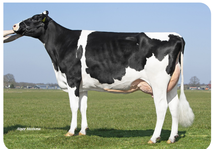
Leida 769 (V. Slash) Bes.: V.O.F. Miskotte, Den Ham (NL)