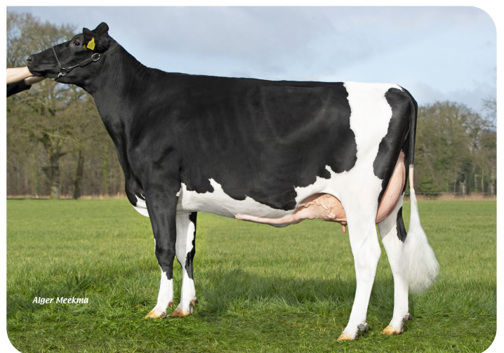
VDR Alessandra RF Mutter von AC/DC RF