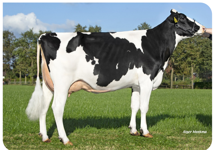
Marianne 361 (V. Tobor) Bes.: Te Voortwis C.V., Winterswijk-Miste (NL)