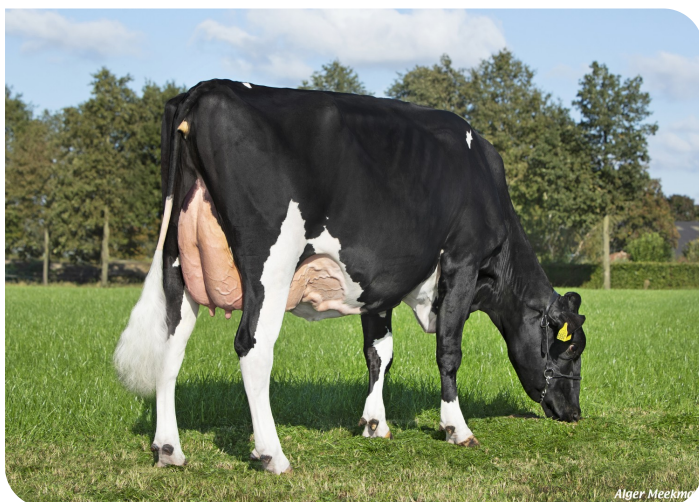
Marianne 359 (V. Tobor) Bes.: Te Voortwis C.V., Winterswijk-Miste (NL)