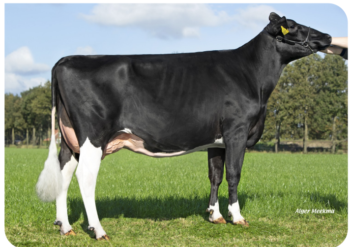
Marianne 358 (V. Tobor) Bes.: Te Voortwis C.V., Winterswijk-Miste (NL)