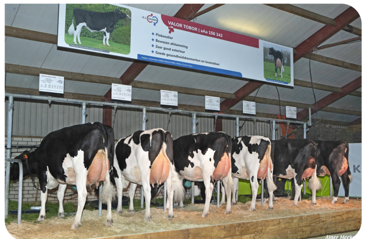
Tochtergruppe von Valor Tobor, Grasdag 2023 Grashoek (NL)