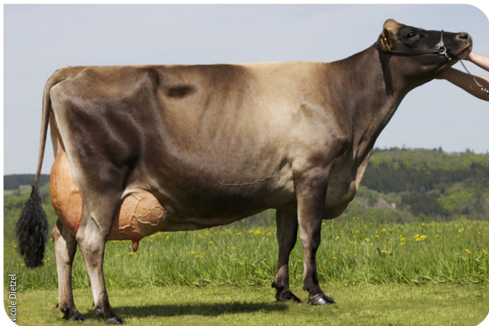
Scholz Evita (PP) (EX 91) Mutter von Napoleon PP