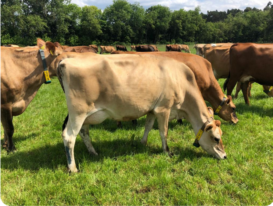
Tochter Napoleon (PP)