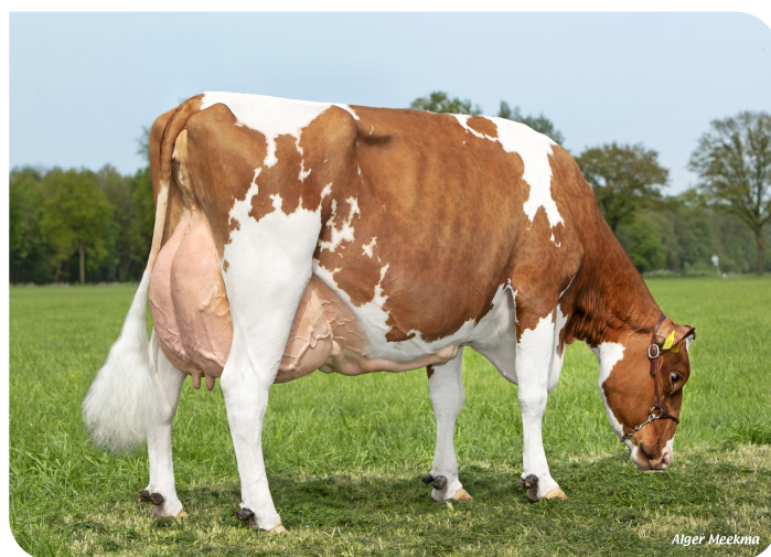
Grashoek Rita 74 (V. Mexx)

Bes.: Fok- en melkveebedrijf K.I. SAMEN, Grashoek (NL)