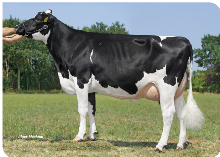
Grashoek Sneeker 308 (V. Mexx) Bes.: Melkveebedrijf Grashoek b.v., Grashoek (NL)