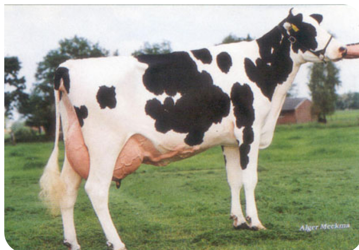
Bontje 89 (dochter van TrioSex)