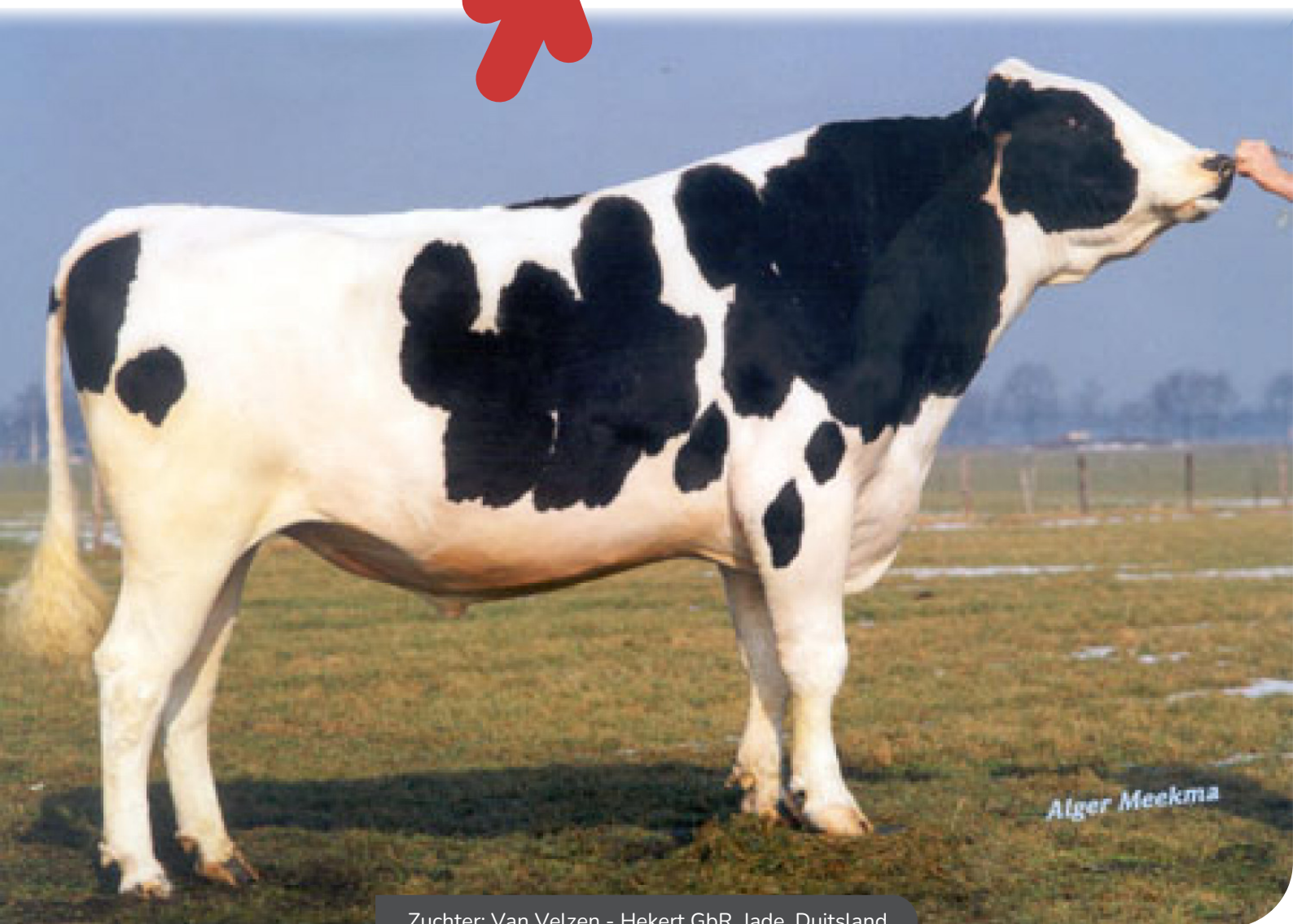
Zuchter: Van Velzen - Hekert GbR, Jade, Duitsland