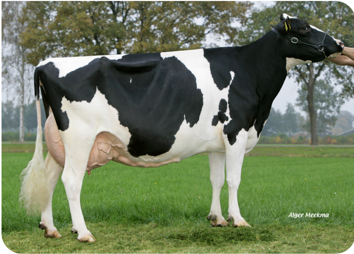
Quarrel 11 (VG 87) (Mutter von Aquarel)