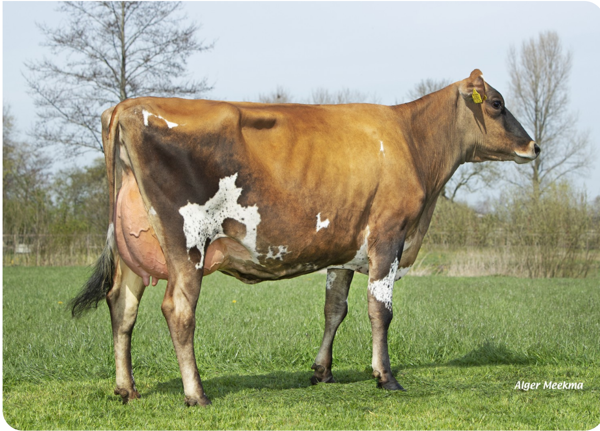
Bossink Dies 57 (V. Sullivan, 50% Jer./50% RHF) Bes.: Van der Kolk Melkvee V.O.F., Wierden (NL)