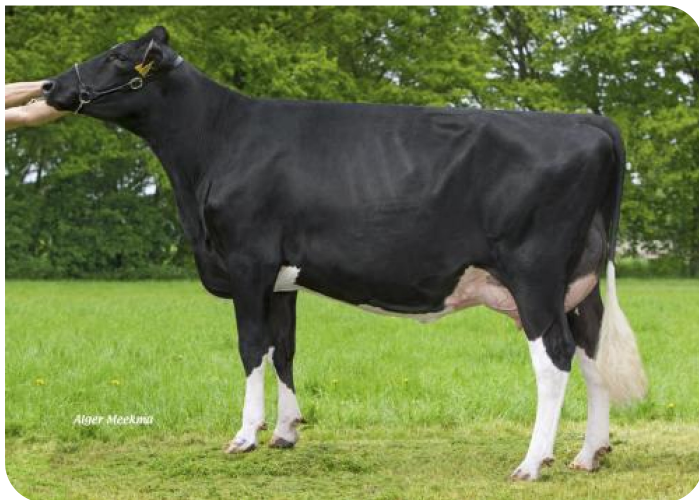
Southland Dellia 191 (V. Goldwave) Bes.: Southland Holsteins, Teteringen (NL)