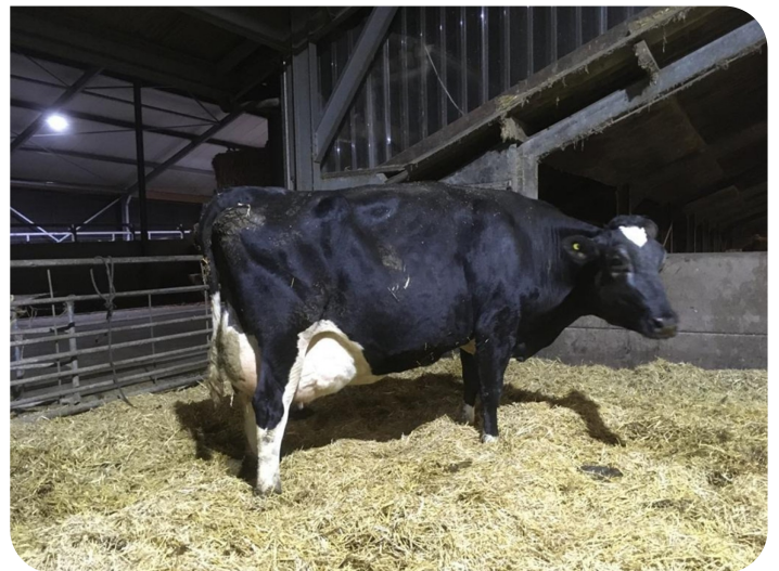
Elsje 184 (Mutter von Silvester)