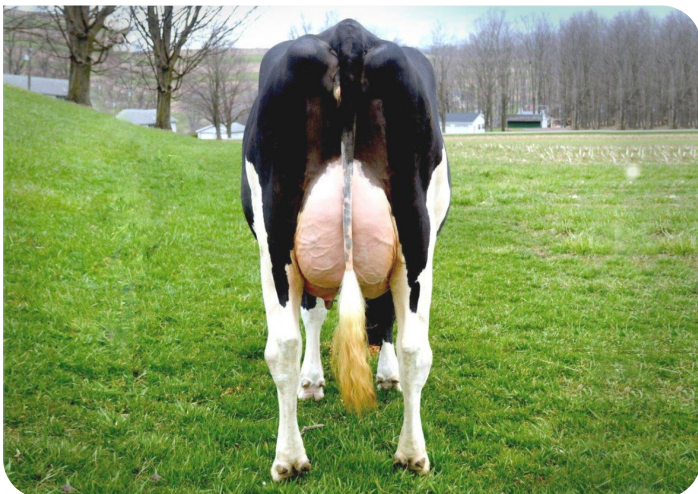
Scenic-Vista Ardels Raya-ET-P Vollschwester von Radix-P rf Bes.: Scenic-Vista Farms, Western Maryland, USA