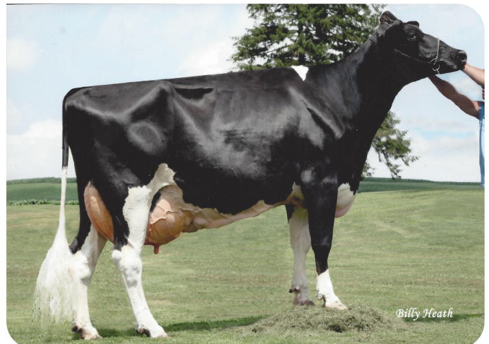
Elk-Lick Durhm Ardel Lea-ET (EX92) (Großmutter von Radix-P rf)