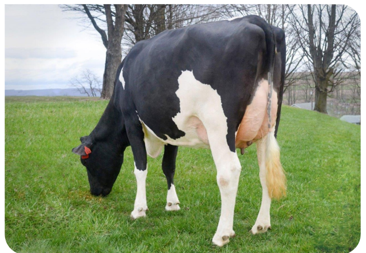
Scenic-Vista Ardels Raya-ET-P Vollschwester von Radix-P rf Bes.: Scenic-Vista Farms, Western Maryland, USA