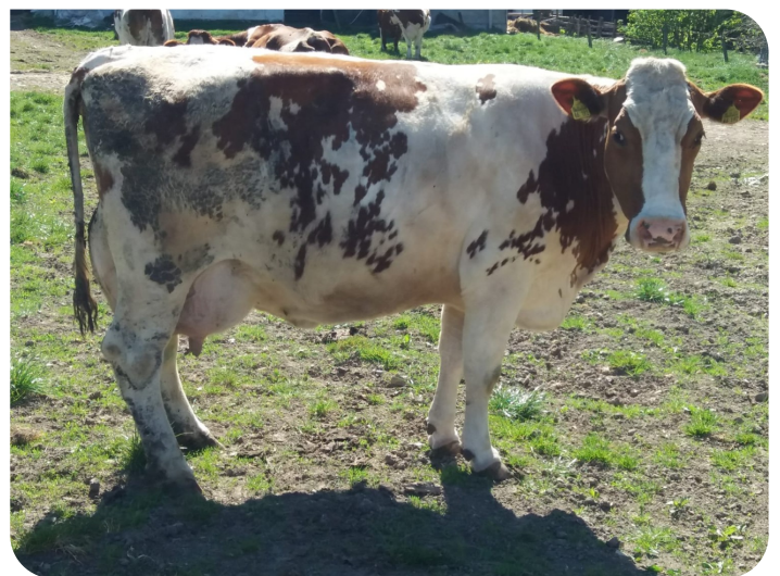
Dea (Mutter de Rintje)