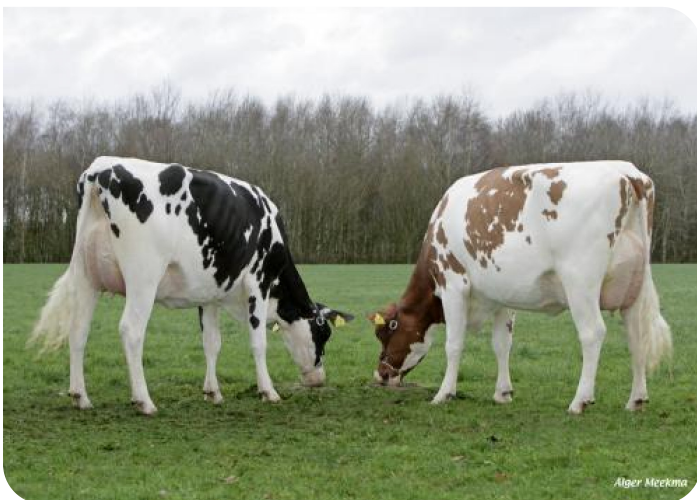
Maga 75 & Irma 28 (V. Norwin rf) Bes.: V.O.F. Gebleektendijk, Nederweert-Eind (NL)