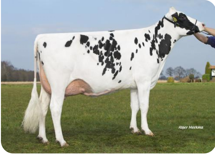
Grashoek Angel 51 (V. Norwin rf) Bes.: Melkveebedrijf Grashoek b.v., Grashoek (NL)