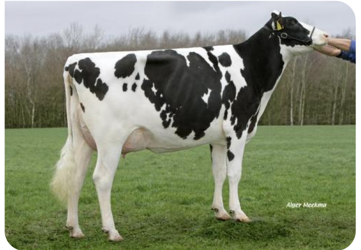
Maga 75 (V. Norwin rf) Bes.: V.O.F. Gebleektendijk, Nederweert-Eind (NL)