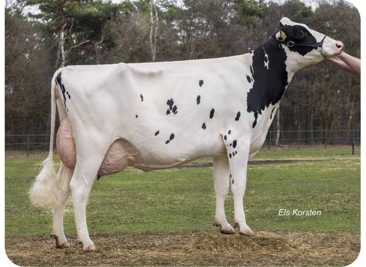
Angels Wiesje 46 (V. Norwin rf)