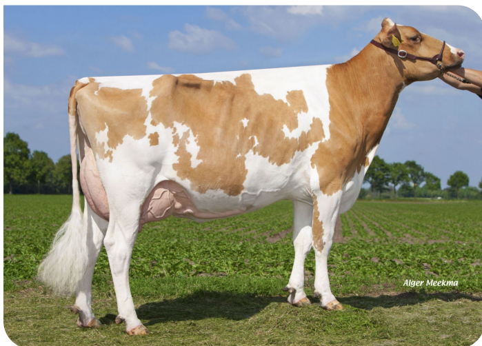
Grashoek Blutchen 51 (EX 90) (V. Norwin rf) (foto nach 2 Abkalbungen) Bes.:Melkveebedrijf Grashoek b.v., Grashoek (NL)