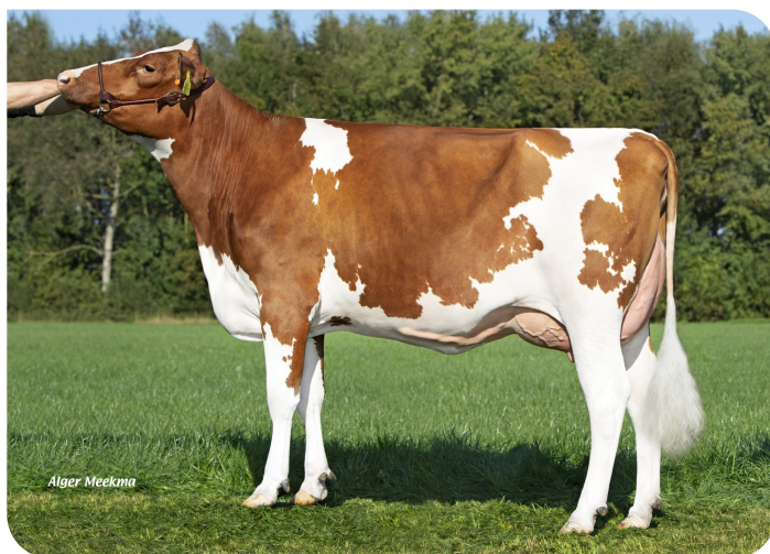
Grashoek Rieka 75 (V. Joran P)

Bes.: Fok- en melkveebedrijf K.I. Samen B.V., Grashoek (NL)