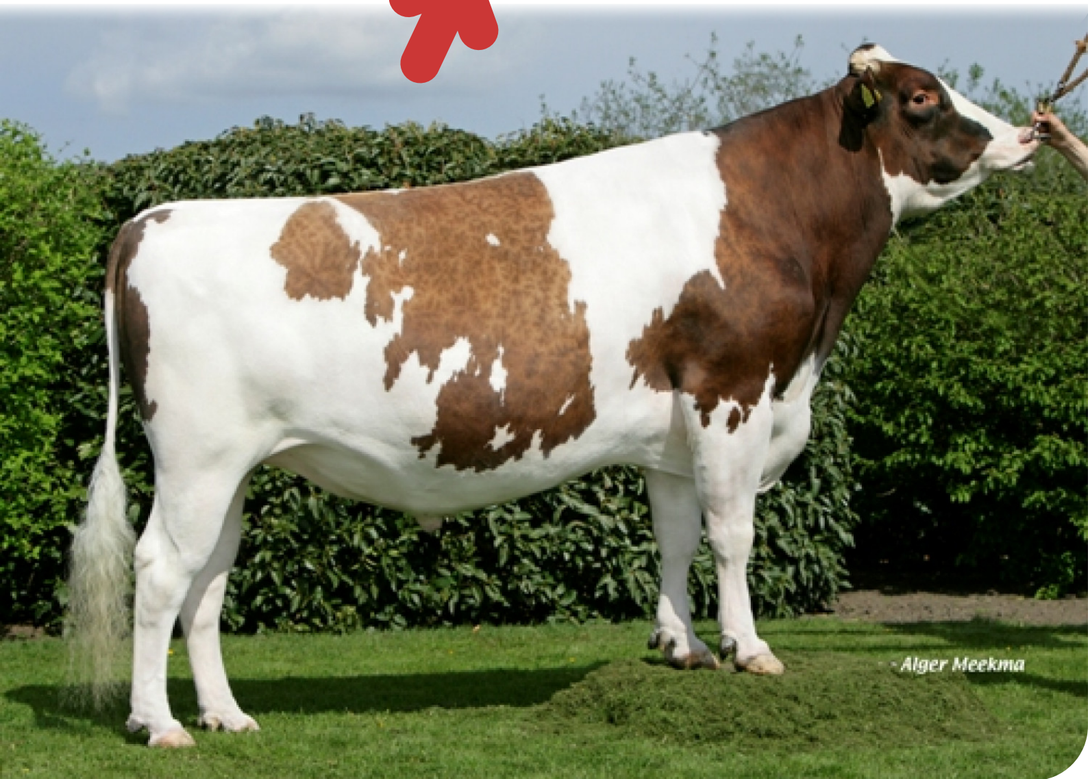
- Alger Meekma