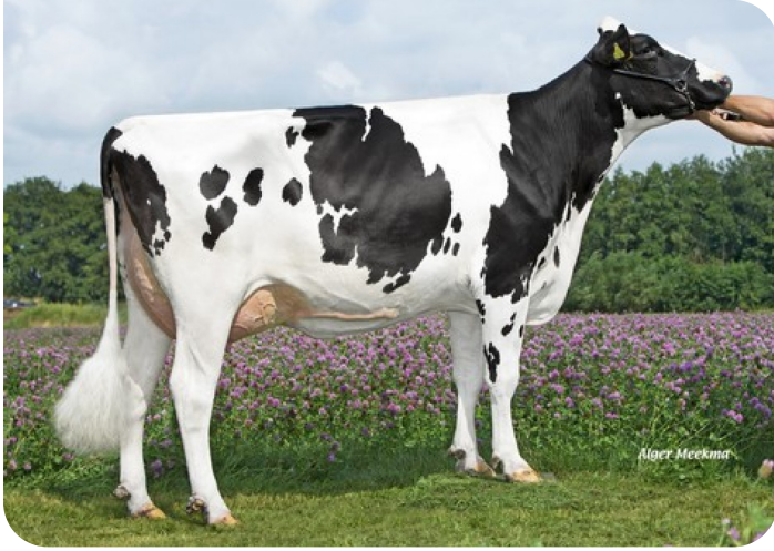
Wilder K41 RDC (VG 87) (Mutter von Kayne)