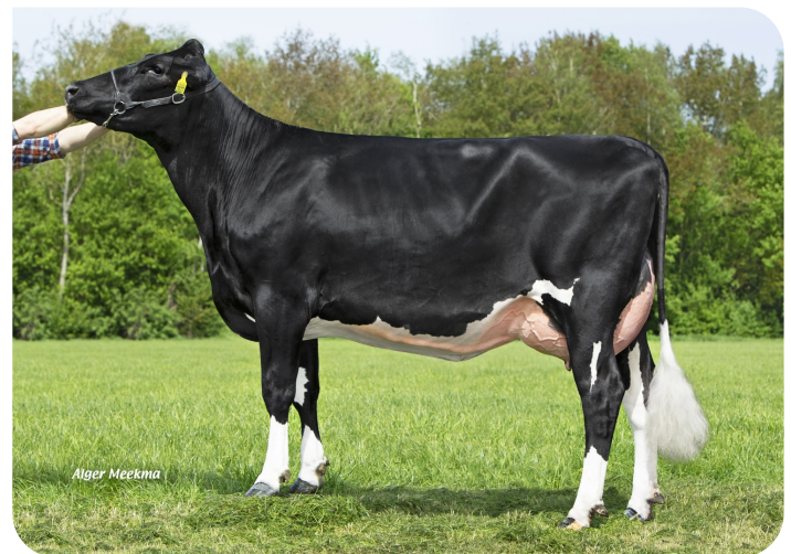
Grashoek Mona-Lisa 47 (V. Kayne) Bes.: Fok- en melkveebedrijf K.I. Samen B.V., Grashoek (NL)