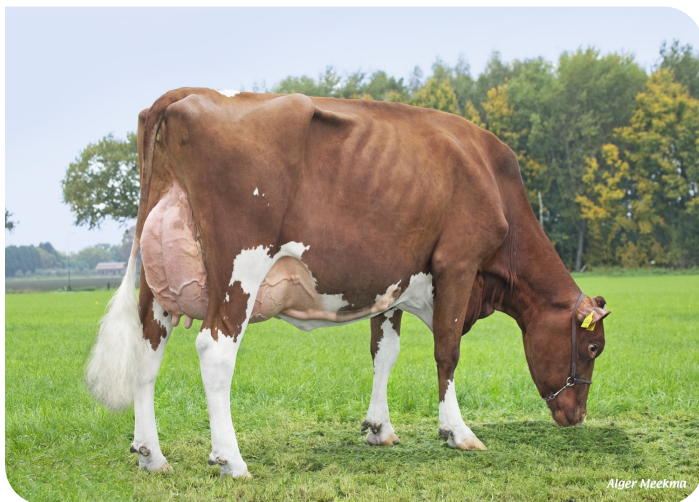
Grashoek Jessie 46 (VG 88) (lact. 2) (V. Fame P) Bes.: Melkveebedrijf Grashoek b.v., Grashoek