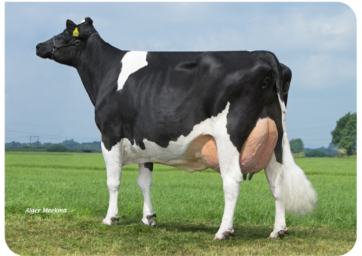
Poppe Fienchen 580 (AB 88) (Urgroßmutter von Fame P)