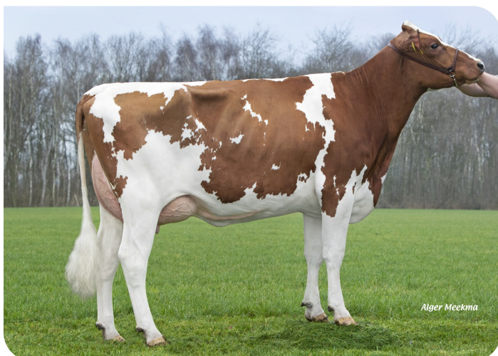
Grashoek Boukje 519 (V. Fame P) Bes.: Fok- en melkveebedrijf K.I. Samen B.V., Grashoek (NL)