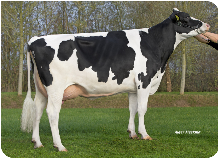
Poppe Fienchen 803 (AB 86) (Großmutter von Fame P)