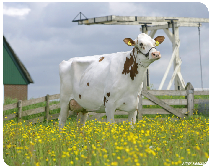
Esmeralda 181 (V. Sunflower PS rf) Bes.: Fa. J.P. & P.H. Köhne, Middenbeemster (NL)