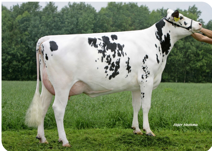
Fientje 785 (V. Sunflower PS rf) Bes.: Mts. Peeters, Kessel (NL)