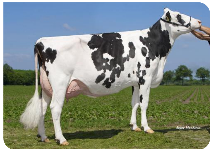
Grashoek Ruth 145 (VG 86) (V. Sunflower PS rf) (foto nach 2 Abkalbungen) Bes.: Melkveebedrijf Grashoek b.v., Grashoek (NL)