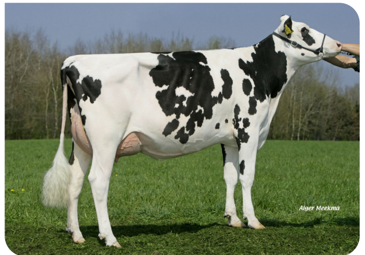
Grashoek Ruth 145 (VG 86) (V. Sunflower PS rf) Bes.: Melkveebedrijf Grashoek b.v., Grashoek (NL)