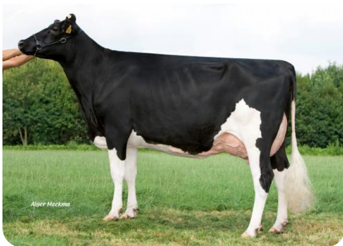
Grashoek Beaver 3 (EX 90) (V. Sunflower PS rf) Bes.: Melkveebedrijf Grashoek b.v., Grashoek (NL)