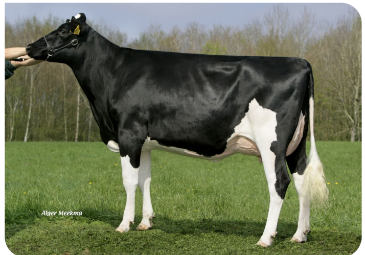
Grashoek Beaver 3 (VG 87) (V. Sunflower PS rf) Bes.:Melkveebedrijf Grashoek b.v., Grashoek (NL)