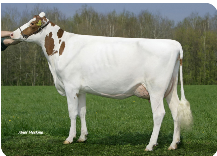
Grashoek Frieska 179 (VG 85) (V. Sunflower PS rf) Bes.: Melkveebedrijf Grashoek b.v., Grashoek (NL)