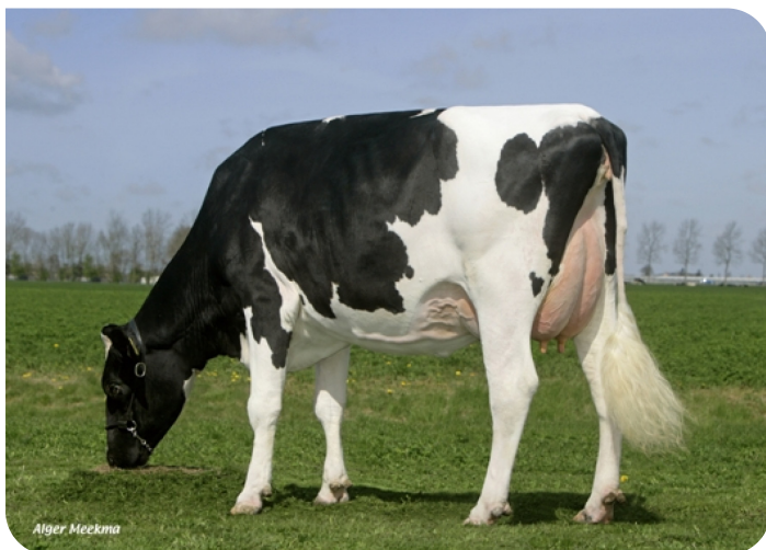
Sophie 180 (V. Maniac PS) Bes.: Herr M. Chattellon, Abbekerk