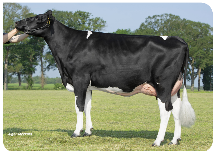
PM Annie 224 (V. Elver rf) Bes.: Mts. Pinkert-Burgers, Markelo (NL)