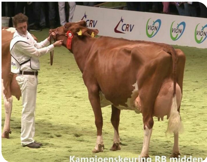
Kampioenskeuring RB midden

P.M. Elza 159 (EX91) (Mutter von Elver rf)