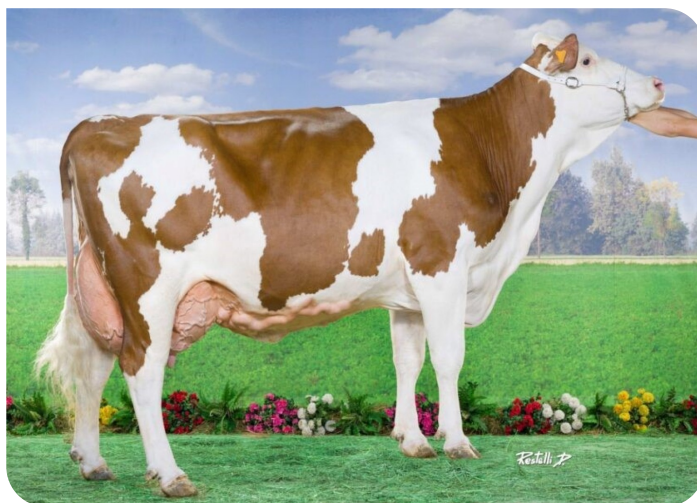
Hollywood (Mutter von Pejy)