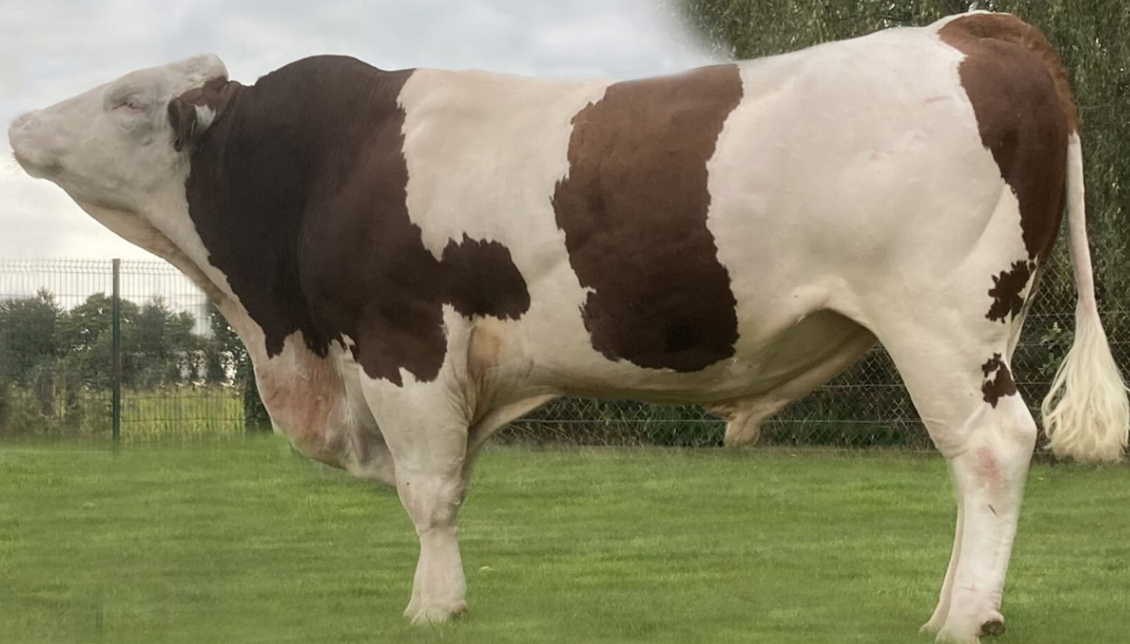
Züchter: Gaec Gaec les Chardonnerets, Frangy, Frankreich