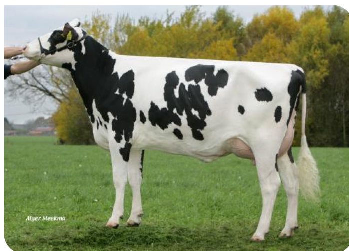
Grashoek Bontje 316 (V. Yes Man) Bes.: Melkveebedrijf Grashoek b.v., Grashoek (NL)