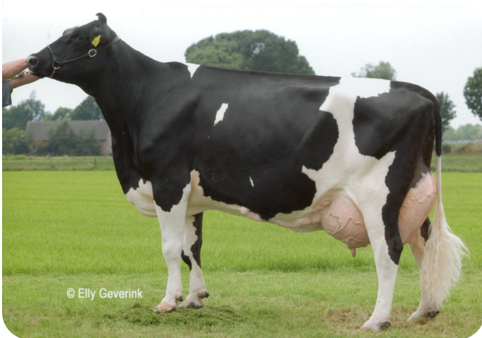
Peeldijker Liesje 385 (EX 90) (Großmutter von Yes Man)