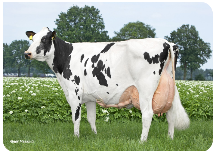
Peeldijker Liesje 992 Urgroßmutter von Pennywise