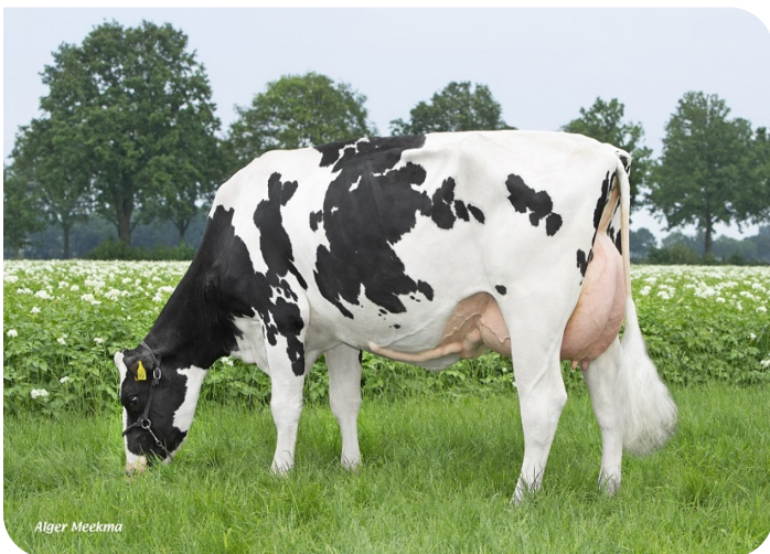
Peeldijker Liesje 1224 Großmutter von Pennywise