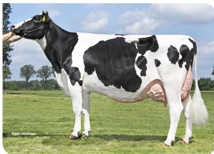
Peeldijker Liesje 1328 Mutter von Pennywise