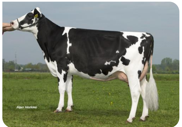
Marijke 276 (V. Action) Bes: Herr H.A. Velderman, Loenen (NL)