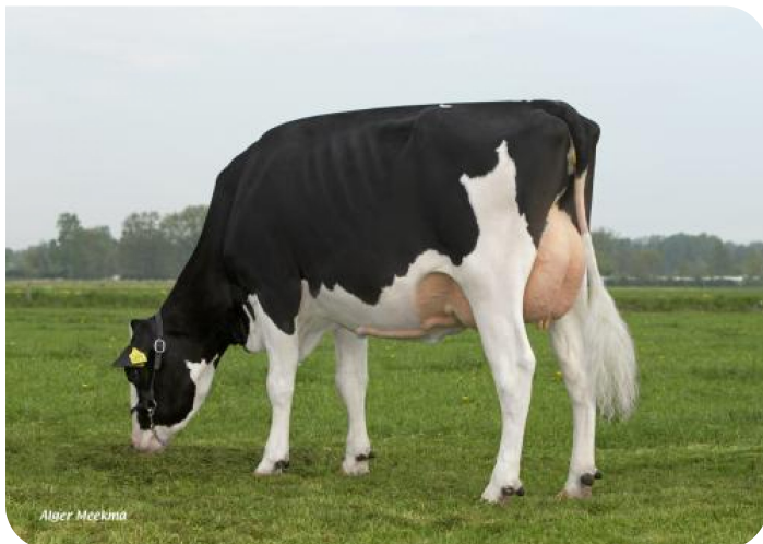
Autrice 3 (V. Action) Bes.: Herr H.A. Velderman, Loenen (NL)