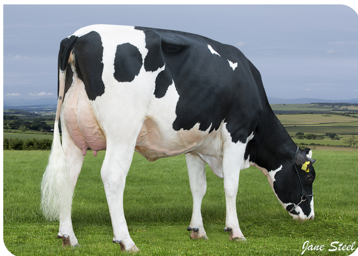
Nortonhill Brook Saratoga Vollschwester von der Mutter von Sumerian