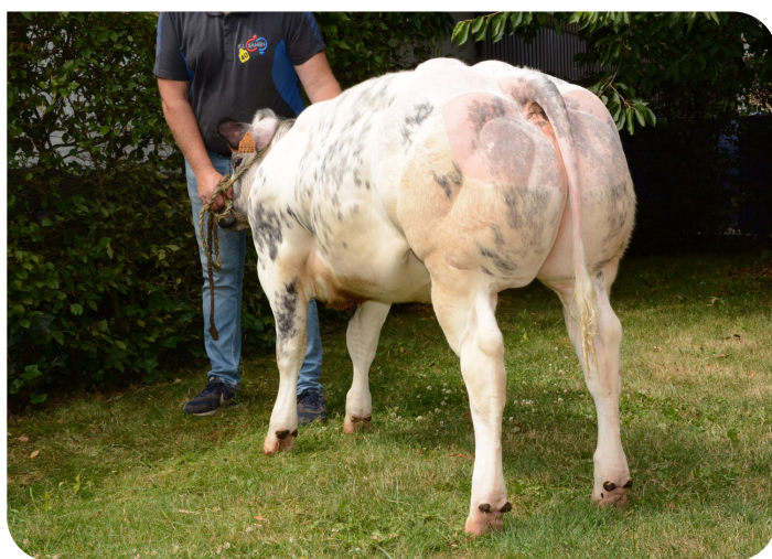
Singapore van de Kiezel (V. Non Stop)