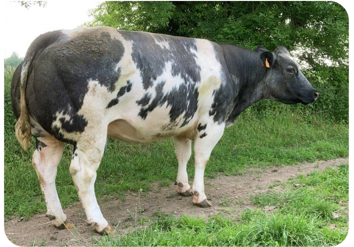
Latente du Pont de Messe Mutter von Non Stop