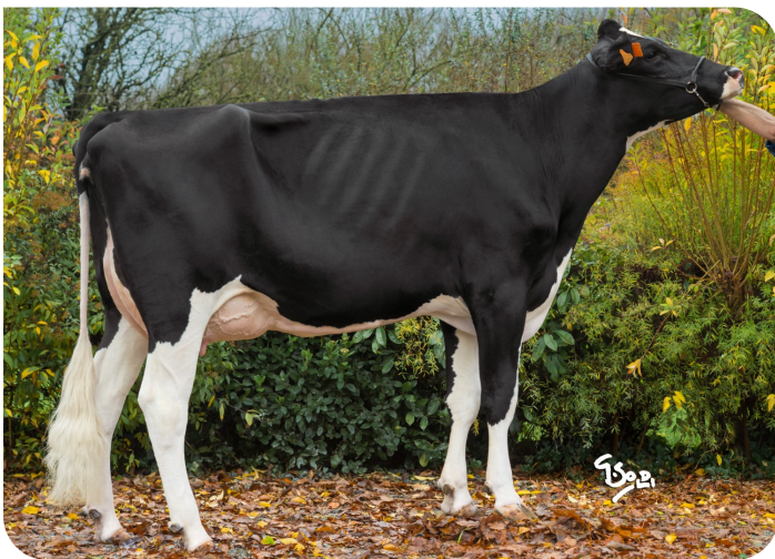
Ideale Großmutter von Neal