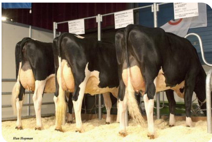
Kojacks Nachzuchtgruppe Schwarzbunt HHH Show 2009