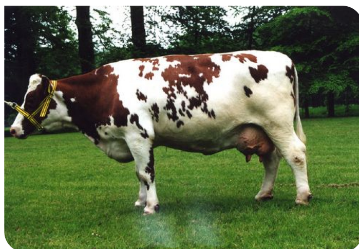
Merlin 29 (Mutter von Gerbert)