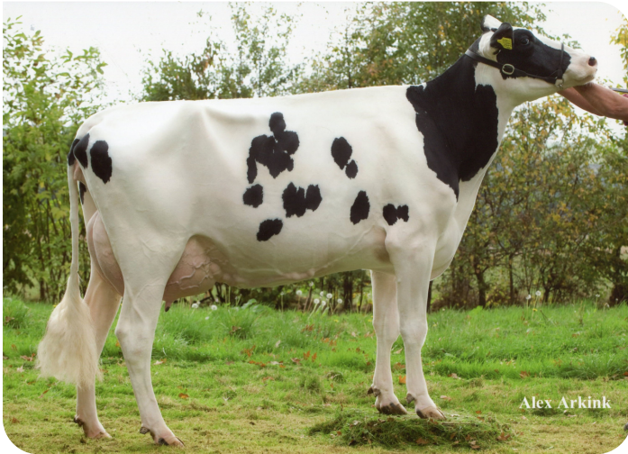
Massia 9397 RF van de Peul (AB 87) (Großmutter von Macgyver)