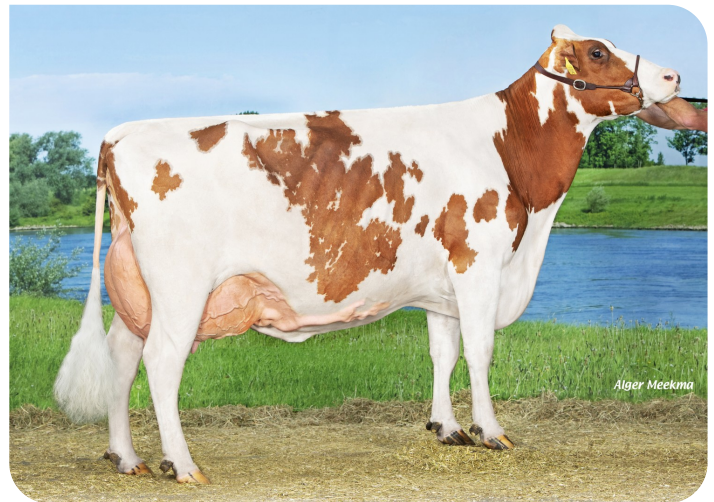
Grashoek Janna 155 (V. Macgyver van de Peul)(4. Kalb) Bes.: Fok- en melkveebedrijf K.I. Samen B.V., Grashoek (NL)