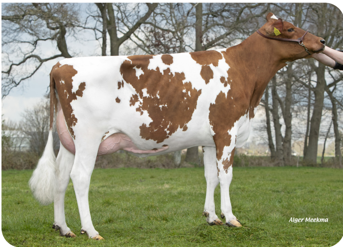
Hanny 71 (V. Macgyver) Bes.: Mts. Overeem, Lunteren (NL)