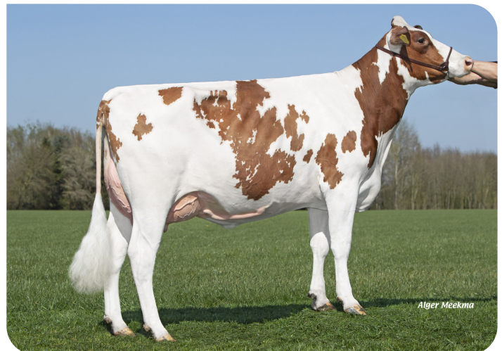
Grashoek Janna 155 (V. Macgyver) Bes.: Fok- en melkveebedrijf K.I. Samen B.V., Grashoek (NL)