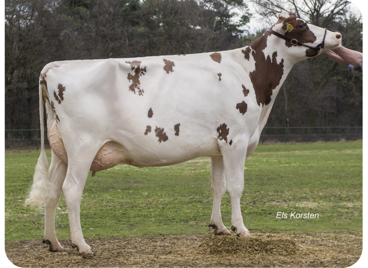
Massia 9857 van de Peul (EX 91) (Mutter von Macgyver)