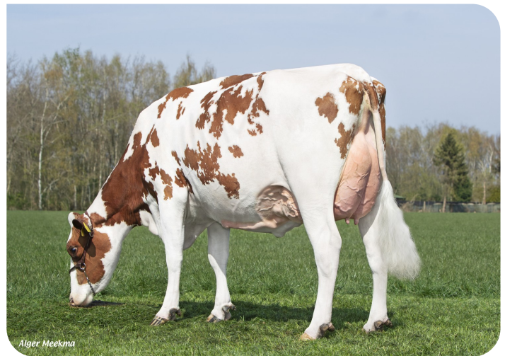
Grashoek Janna 155 (V. Macgyver) Bes.: Fok- en melkveebedrijf K.I. Samen B.V., Grashoek (NL)