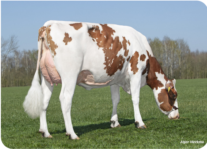
Grashoek Janna 155 (VG 89) (V. Macgyver) Bes.: Fok- en melkveebedrijf K.I. Samen B.V., Grashoek (NL)