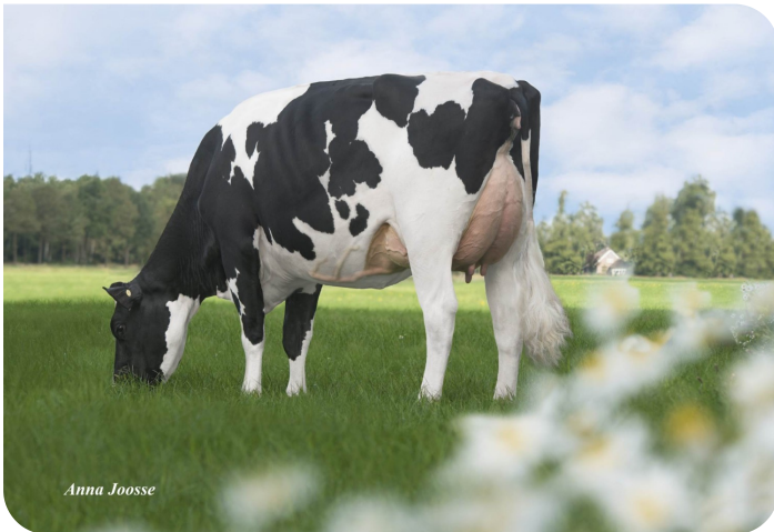
De Oosterhof Dg Rose D Großmutter von Robin Red