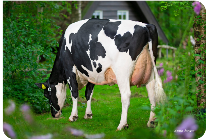
De Oosterhof Dg Rose D (VG89) Großmutter von Robin Red