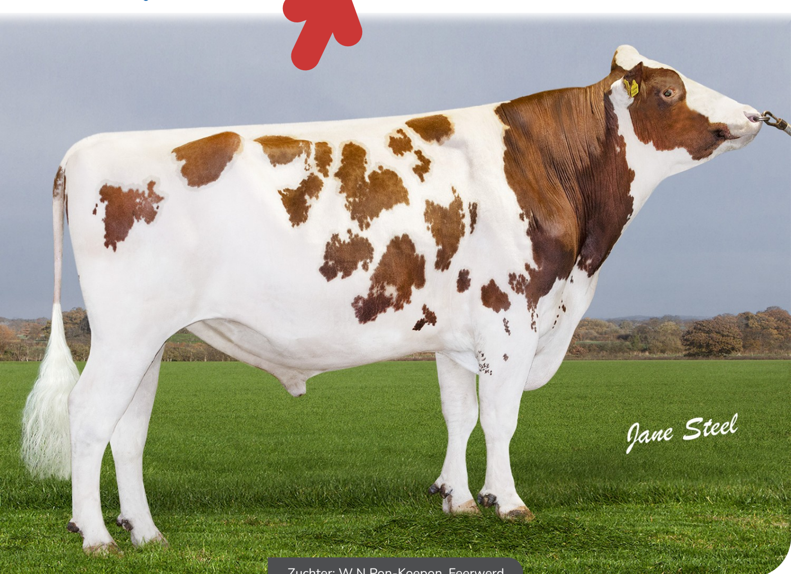
Zuchter: W N Pon-Koepon, Feerwerd