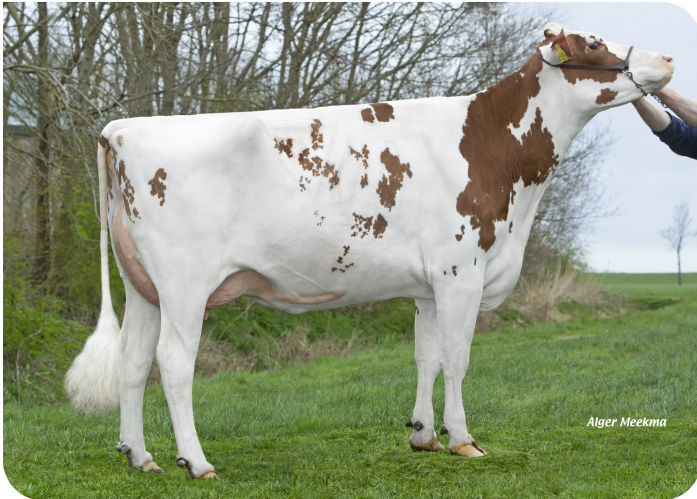
Lakeside Ups Red Range (VG86) Mutter von Robin Red