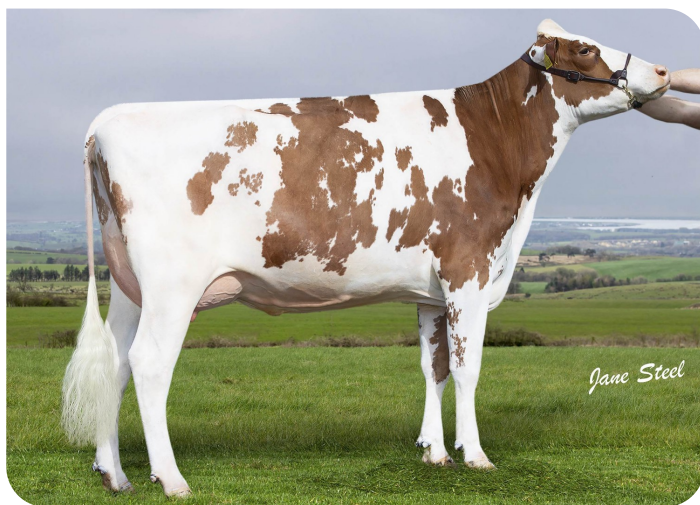
Wyredale Refind Trixie-Red (VG86)(V. Robin Red)