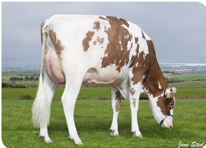
Wyredale Refind Trixie-Red (VG86)(V. Robin Red)