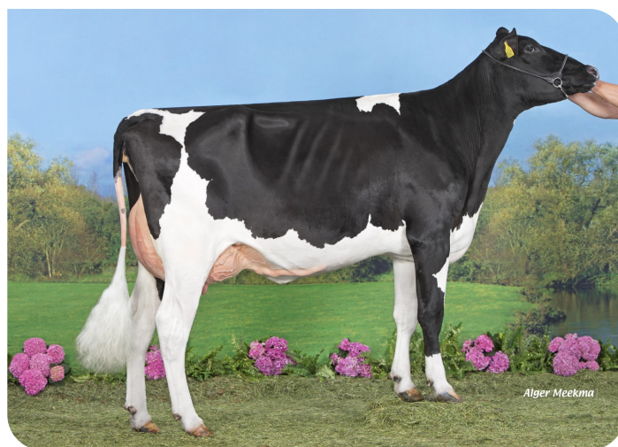
Koepon Pbal P Doma 5 (Großmutter von Debut PP)