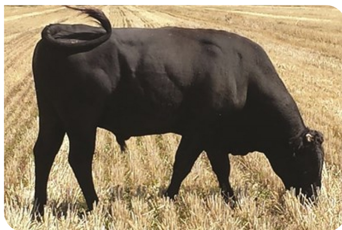
Itomoritaka (Vater von Kentaro)