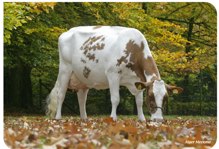
J&G Meisi 5 (VG 89) (Mutter von Marsman)