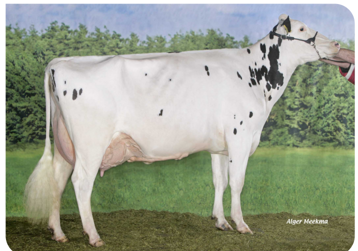
J&G Redspot 16 (EX 90) (Großmutter von Gidion)