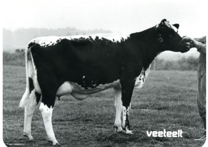
Reigerbek (Mutter von Ijdel)