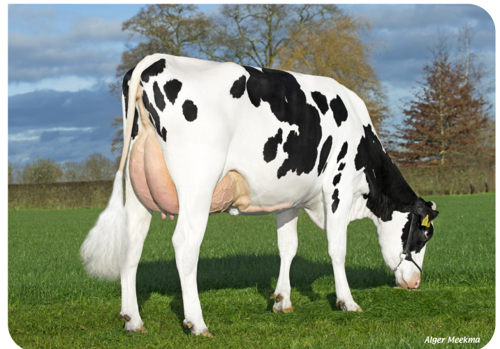
Holbra Malon 13 (Foto nach 2 Abkalbungen) (V. Esmar) Bes.: Mts. Holmer-Hesselink, Laren (NL)