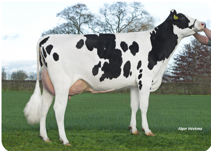
Holbra Malon 13 (Foto nach 2 Abkalbungen) (V. Esmar) Bes.: Mts. Holmer-Hesselink, Laren