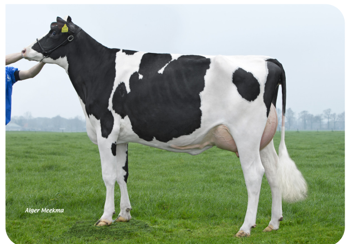
Hoekland Kekke 105 (VG 86) (V. Bono) Bes.: Vogels, Erp