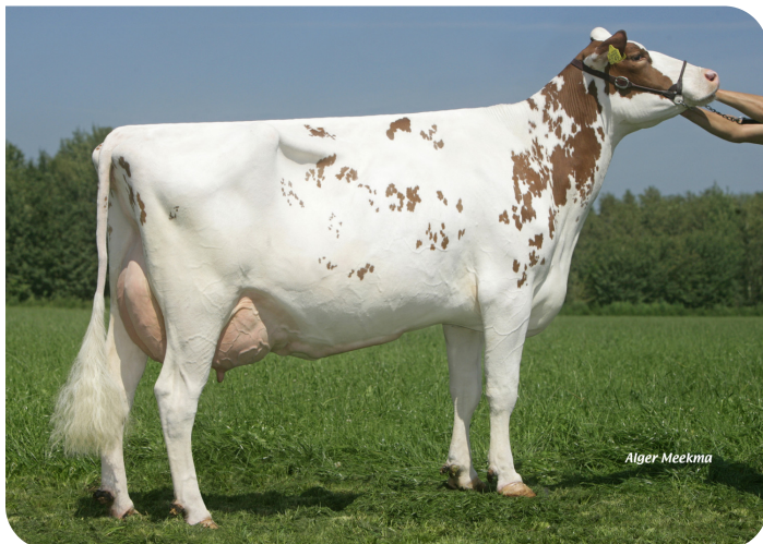
Willem's Hoeve Rita 0249 (VG 87) (Großmutter von Time Zone (Pp))