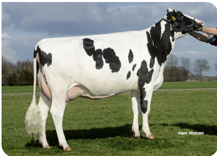
Grashoek Silke 78 (VG 88) (Großmutter von Talent rf)