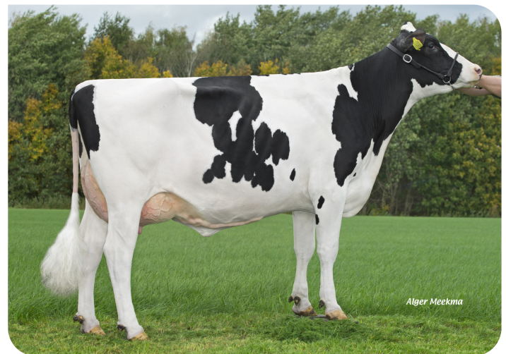
Grashoek Nel 150 (V. Talent rf) Bes.: Fok- en melkveebedrijf K.I. Samen B.V., Grashoek (NL)